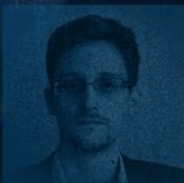
SNOWDEN ЭДВАРД ДЖОНСОН Ф. СНОУДЕН