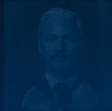
ASSANGE CHIEF OF WIKILEAKS (2006-2010) BORN 3 JULY 1971